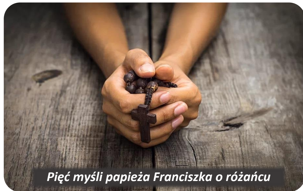
Pięć myśli papieża Franciszka o różańcu

Jak skuteczna jest wiara, gdy jest dojrzała! Jest taka, gdy człowiek przyjmuje obecność Boga w swoim życiu z prostotą i ufa Jego mocy. Taką wiarę miał niewidomy, o którym opowiada dzisiejsza Ewangelia. Zapewne wcześniej słyszał o Jezusie i o Jego licznych uzdrowieniach. To mu dawało nadzieję, że może i dla niego Jezus okaże się uzdrowicielem. „Synu Dawida, Jezusie, zmiłuj się nade mną” – te słowa, wykrzyczane z ufnością, są krótką formułą wyznania wiary w Jezusa – obiecanego Mesjasza, który pochodzi z królewskiego rodu Dawida. Zawierają w sobie silną nadzieję, jaką Bartymeusz pokłada w Nauczycielu z Nazaretu. Niewidomy ma tylko jedną prośbę: aby mógł widzieć. I stało się tak, jak wierzył. Jak bardzo owocne było to spotkanie człowieka niewidomego ze światłem Boga. Święty Jan w Prologu do swojej Ewangelii pisze o Logosie – wcielonym Synu Bożym: „Była światłość prawdziwa, która oświeca każdego człowieka” (J 1, 9).